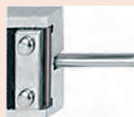
Jauge de profondeur ronde pour petits alésages